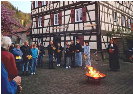
Osterfeuer bei der Osternachtsfeier im Kirchhof der Johanneskirche