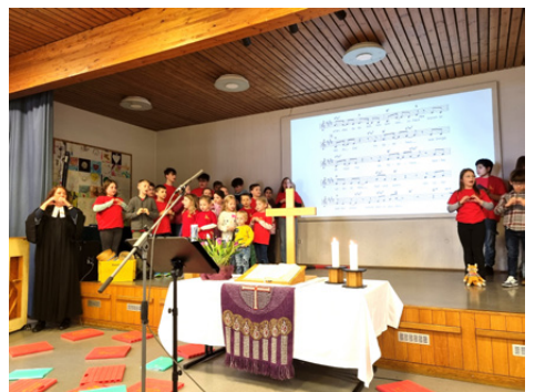
Einer-für-Alle-Gottesdienst „Schau hin!“ mit dem Kinder- und Jugendchor des Sängerbunds