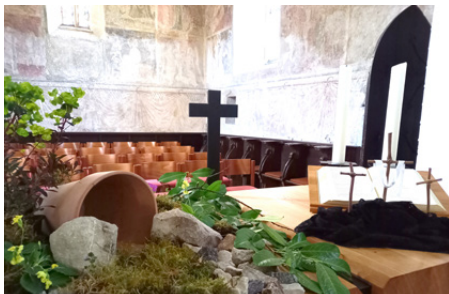
Das leere Grab auf dem Altar der Johanneskirche