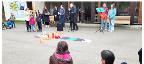
Kreuzweg (nicht nur) für Kinder am Karfreitag in Honau